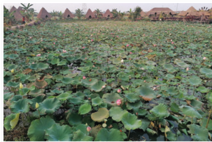
Na lotosovih poljih

Tudi mi smo se tam vozili s čolnom in se malo ustavljali, saj so imeli domačini v roka-