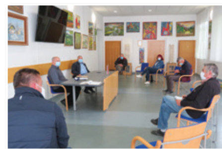
Nošenje mask v zaprtih prostorih je še vedno priporočljivo, saj z masko ne ščitimo sebe, temveč druge. Drugi pa z uporabo mask ščitijo nas.

1. junija je bil prvi dan po epidemiji. Tega dne je predsednik vlade Janez Janša nagovoril državljanke in državljane ter med drugim dejal, da je Slovenija med najuspešnejšimi državami na svetu v boju z epidemijo koronavirusa. Po njegovih besedah je Evropska komisija v svoji zadnji napovedi pri nas sprejete ukrepe ocenila zelo pozitivno. Po njihovi presoji ima