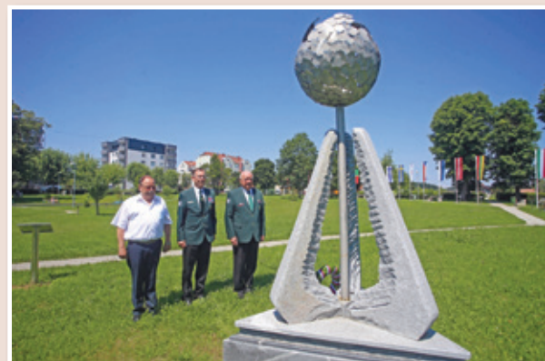
Položitev venca pri spomeniku osamosvojitve