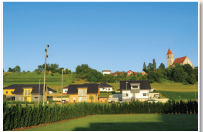
Ker je v Benediktu veliko novih hiš, je tudi vse več mladih družin in otrok, ki se že veselijo novega motoričnega koticika.

Občini Benedikt, ki sodi po povprečni starosti prebivalcev med najmlajše v Sloveniji, nameravajo urediti Motorični kotic, ki bo namenjen zlasti najmlajšim in starejšim, seveda pa tudi vsem drugim občanom in občanom, ki skrbijo za rekreacijo in zdrav življenjski slog. Motorični kotic, ki bo Benedičankam in Benedičanom popestril možnosti za prosto časovne aktivnosti, bo lociran zraven igrišča