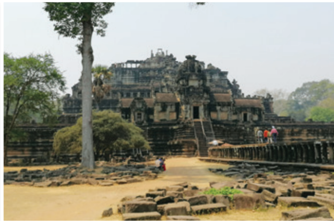
Angkor Thom, največji objekt na gruntu