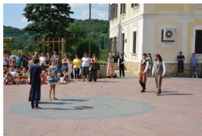
Oživitev trškega jedra z učenci OŠ J. Hudalesa Jurovski Dol