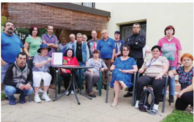
Stanovalci in zaposleni (na fotografiji DBE Maribor) so ponosni, da so pridobili certifikat E-Qalin.

v kateri je delovala predstavnica zakonitih zastopnikov stanovalcev in vodstvena skupina. V prav vseh skupinah so sodelovali tudi stanovalci. V presojanem obdobju so obravnavali 65 kazalnikov in 25 kriterijev. Zaključek presoje je bil, da zavod uresničuje svoje poslanstvo tako, da v ospredje postavlja stanovalca in izvajanje kvalitetnih storitev po meri stanovalca. Posebno skrb namenja individualnemu načrtovanju ter da stanovalce