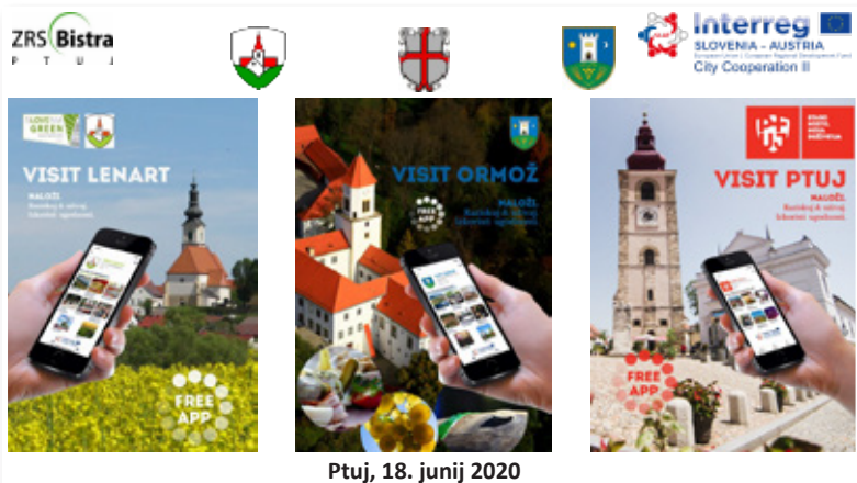
Ptuj, 18. junij 2020

V okviru projekta so bile izdelane tri aplikacije za pametne telefone: