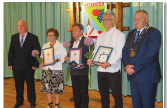
Namesto osrednje proslave ob 22. občinskem prazniku so letos v Občini Cerkevjak pripravili razširjeno slovesno sejo občinskega sveta, na kateri so podelili priznanja in nagrade najbolj zaslužnim in uspešnim.

Po razširjeni seji občinskega sveta je bila v cerkvi sv. Antona slovesna maša ob občinskem prazniku. Po njej so pripravili priložnostno druženje ob stojnicah na trgu pred občino, kjer je za praznično vzdušje poskrbel pihani orkester MOL iz Lenarta.