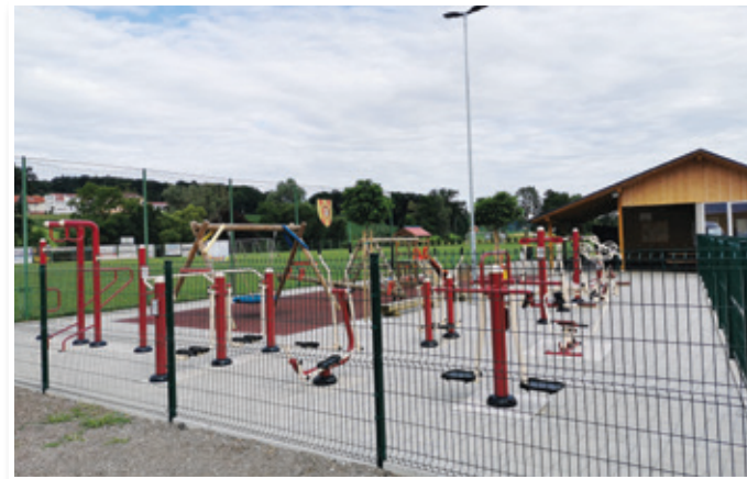
Z 28. majem 2020 je jurovska občina sprostila ukrepe ob omejitvi uporabe športnih površin na območju občine. Uporabnike otroških igral in fitnesa na prostem prosijo, naj upoštevajo priporočila NIJZ.

Sprejet je bil tudi sklep o spremembah in dopolnitvah Sklepa o določitvi ekonomske cene vrtca v občini, ki po novem določa, da morajo starši, ki so prvič vpisali otroka v vrtec za naslednje šolsko leto, ob podpisu pogodbe poravnati akontacijo v višini 50 €. Na osnovi prejetega plačila in podpisane pogodbe bo otroku zagotovljeno mesto v vrtcu. Akontacijo bo vrtec poračunal po prvem mesecu obiskovanja programa. V kolikor starši ne pripeljejo otroka v vrtec na dan, ki je določen