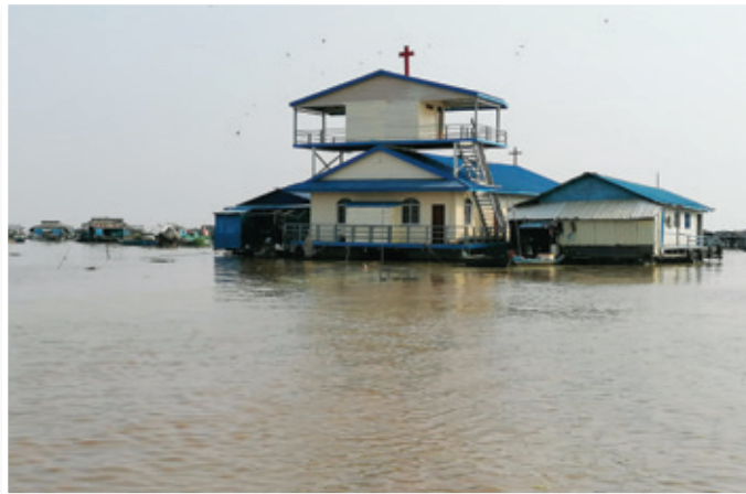
Plavajoča krščanska cerkev v Kambodži