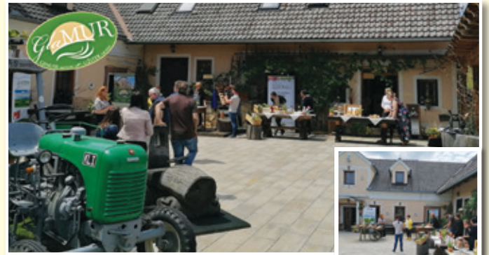
Snemanje je na Domačiji Firbas potekalo v sproščnem vzdušju

Avstrijski partner LAS Vulkanland čez poletje pripravlja spletno stran, na kateri bodo predstavljeni tudi vsi slovenski ponudniki, ki so vključeni v blagovno znamko Glamur. S sistematično načrtovanimi promocijskimi aktivnostmi bodo tako regionalni produkti kot tudi lokalna ponudba Slovenskih goric, Prlekije in Vulkanlanda dodali svoj del k višji ravni lokalne samooskrbe in večji prepoznavnosti naše turistične ponudbe. Prav lokalna samooskrba je bila eden ključnih dejavnikov, ki je močno vplival na življenje v teh kriznih časih, zato ji je tudi v običajnih razmerah potrebno posvečati več pozornosti. V tem oziru lahko informacije o lokalni ponudbi že zdaj najdete na brezplačni mobilni aplikaciji Klopotec,