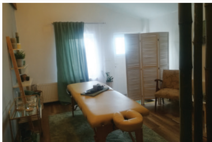
Notranjost masažnega salona