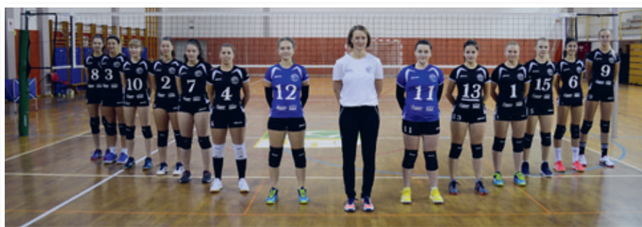
Članska ekipa OK Benedikt

V prvem delu smo odigrale nekaj izjemno dobrih tekem. Do konca koledarskega leta smo tako dosegle 5 zmag in 6 porazov. Kar 4 tekme (dve zmagi in dva poraza) smo odigrale 5 nizov, kar pomeni, da ob zmagi nismo prejele vseh treh točk, pa vendar smo tudi ob porazu dobile eno točko. V novem koledarskem letu in v drugem delu sezone smo si želele še več. Pridno smo trenirale, se maksimalno borile tudi na treningih, kar se je izjemno obrestovalo. Prve 3 tekme smo nastopile suvereno in premagale nasprotnice. Med njimi so bile tudi tedaj prvovrščene punce iz Murske Sobotne. Zadnja tekma, ki smo jo odigrale 7. marca, je bila proti ekipi iz Mislinje. Punce so na domačem terenu odigrale dobro tekmo in si priborile zmago.