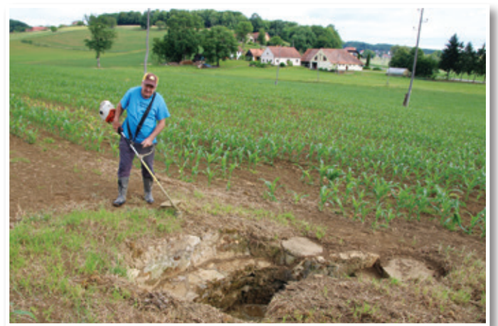
Pogled na Špinglarjevo slatino, ki se nahaja na Špindlerjevi njivi, s katere seže pogled na Špindlerjevo domačijo.

tonskih cevi, uredil pipo za natakanje slatine, obenem v zemljo položil 150 m cevi za odvod slatine, ki stalno priteka iz zemlje, do bližnjega potoka. S tem smo izsušili del njive, ki sedaj, ko smo združili parcele, v enem kosu meri 6,5 ha. Ker po slatino nihče ne hodi več, pač do nje ni poti, kajti njiva je v celoti zasajena s koruzo. Vprašanje je tudi, če je slatina, ker je okoli nje njiva, ki je gnojena z umetnimi gnojili, izvaja pa se tudi škropljenje proti plevelu, užitna. Meni je bil glavni namen, da se slatina ohrani za zanamce.«