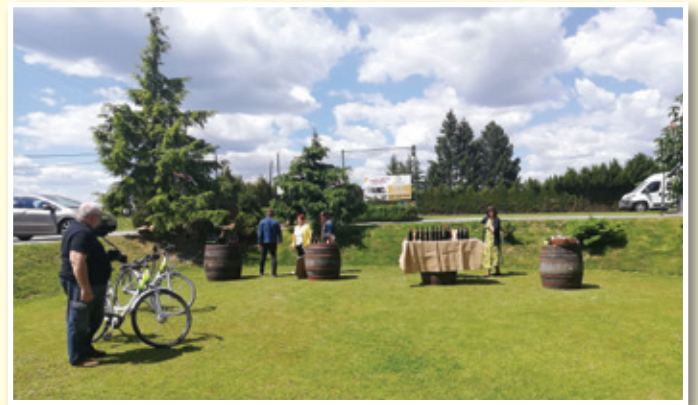
V Jakobskem Dolu

aktualno ponudbo hrane pa bomo mesečno osveževali na spletni strani www.rasg.si .