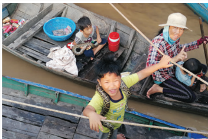
Na lovu za udomačeno rečno kačo