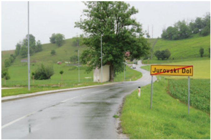
Asfaltirane kolesarske poti, ki bodo speljane ob regionalni cesti in bodo široke 2,6 metra, bodo lahko v nadaljevanju s pridom uporabljali tudi pešci, invalidi, matere z otroki in drugi, ki danes na cestah brez pločnikov niso najbolj varni.

ki bo dolga 4,5 kilometra. Tudi trasa 14 bo v naravi kolesarska steza od Jurovskega Dola preko Voska do Pesnice v dolžini 11,1 kilometer. Skupno bodo tako na območju Občine Sveti Jurij v Slovenskih goricah zgradili okoli 6 kilometrov asfaltiranih kolesarskih stez, širokih 2,6 metra. Te kolesarske steze bodo celo malce širše od marsikatere lokalne ceste, ki so jo zgradili v preteklosti.