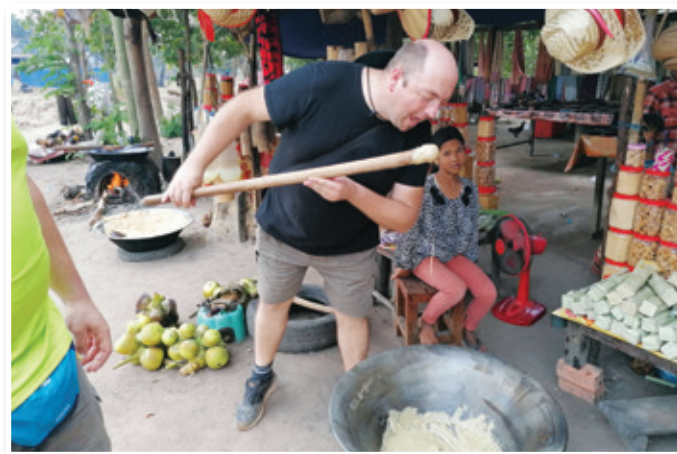
Priprava palmovega masla po štajersko