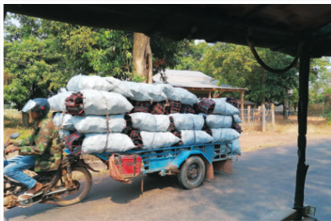
Moped je v Kambodži tudi tovorno vozilo