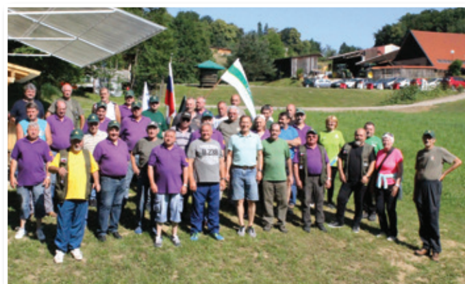
Vedro razpoloženi pred začetkom tekmovanja

bombo in se pomerili v streljanju z zračno puško. Najbolj zagreti pa so v bližnjem rib-