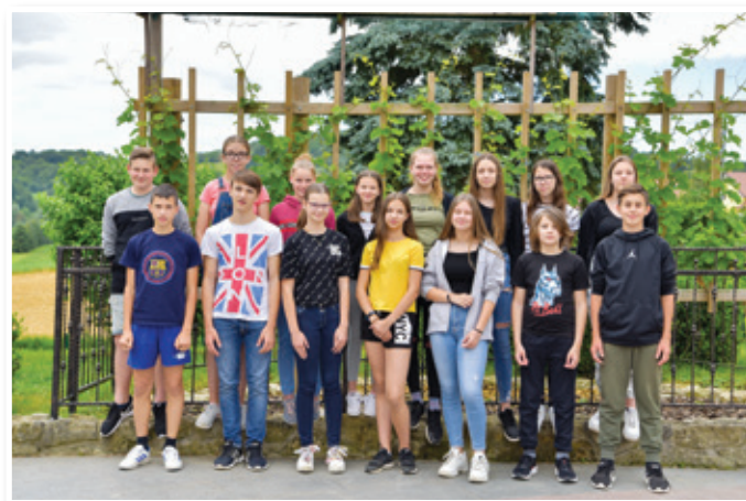
Učenci, ki so prejeli zlato priznanje