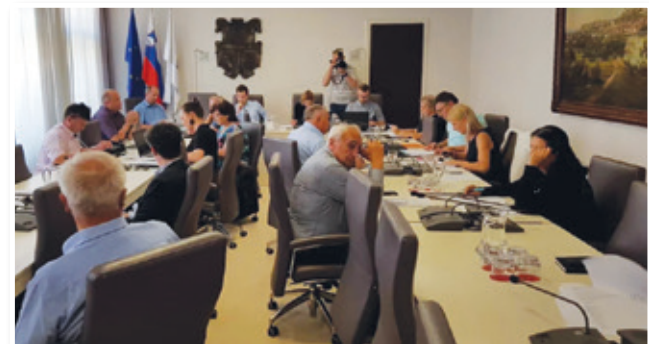
Izredna seja Kolegija županov spodnjega Podravja 23. 6. 2020: vendarle skupaj v razpis za izdelavo projektne dokumentacije za obnovo vodovoda, a le za skupne vode.

Ker se projekt za nujno obnovo vodovodnega sistema v Spodnjem Podravju, s katerim se namerava 19 občin iz Spodnjega Podravja in Slovenskih goric potegovati za evropska sredstva, že skoraj leto in pol ni premaknil z mrtve točke, so se občine Sveti Andraž, Sveta Trojica, Cerkevjak, Desternik in Trnovska vas na začetku junija odločile projekt pospešiti z odstopom od skupne priprave projektne dokumentacije ter najavo, da bodo s ciljem pospešitve obnove same poskrbele za pripravo projektne dokumentacije za svoj del vodovodnega sistema. S svojo namero je pet občin uspelo. Njihova poteza je namreč spodbudila vse občine iz Spodnjega